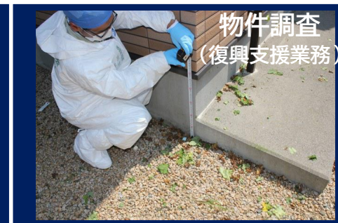
物件調査 (復興支援業務)