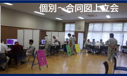
個別～合同図上立会